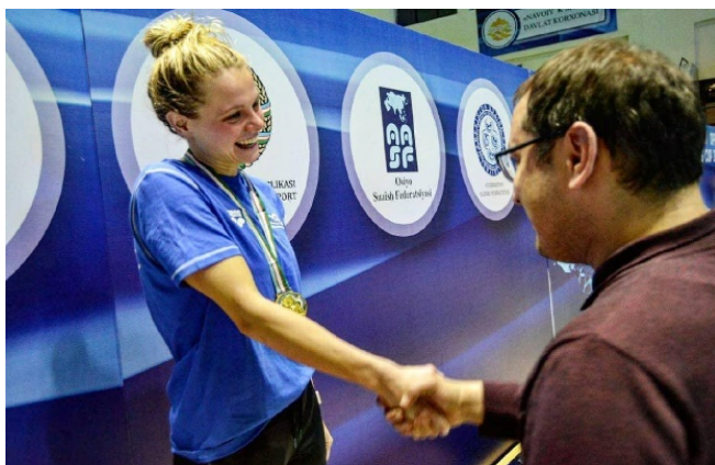
A je to tam!